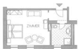
Zimmertyp B Belegung 2+0 Nr. 216