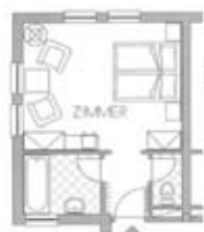
Zimmertyp B Belegung 2+0 Nr. 106 208