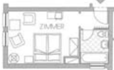
Zimmertyp A Belegung 2+0 Nr. 104 206