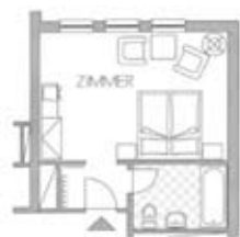
Zimmertyp B Belegung 2+0 Nr. 110 212 310