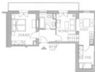
Zimmertyp I Belegung 4+2 Nr. 612