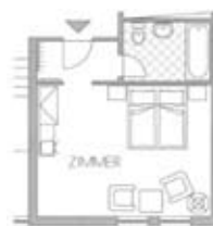
Zimmertyp A Belegung 2+0 Nr. 111 213 311