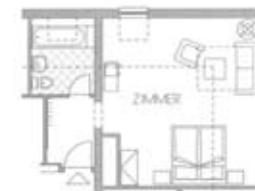
Zimmertyp C Belegung 2+1 Nr. 408