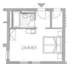
Zimmertyp A Belegung 2+0 Nr. 103 205 306