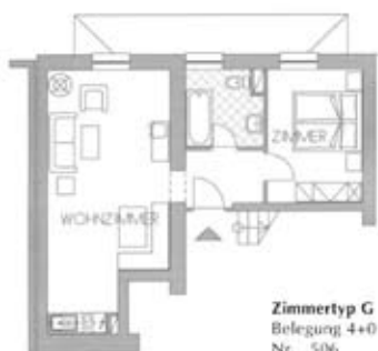
Zimmertyp G Belegung 4+0 Nr. 506