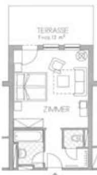
Zimmertyp C Belegung 2+0 Nr. 609