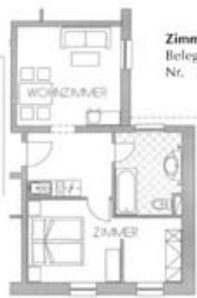
Zimmertyp G Belegung 4+0 Nr. 313