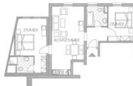
Zimmertyp H Belegung 6+0 Nr. 112 214 312