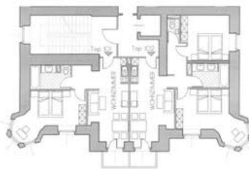
Typ Nr. Typ G Typ H