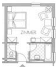
Zimmertyp B Belegung 2+0 Nr. 107 209