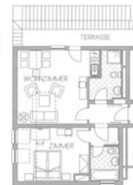
Zimmertyp G Belegung 4+0 Nr. 406