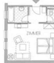
Zimmertyp C Belegung 2+1 Nr. 105 207