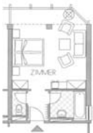
Zimmertyp C Belegung 2+1 Nr. 607