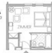
Zimmertyp B Belegung 2+0 Nr. 108 210 308