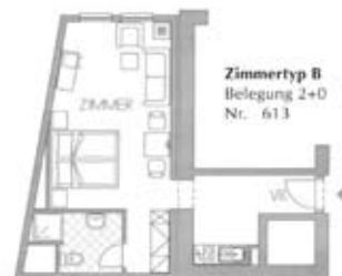
Zimmertyp B Belegung 2+0 Nr. 613