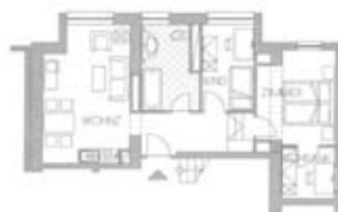
Zimmertyp I Belegung 4+2 Nr. 614