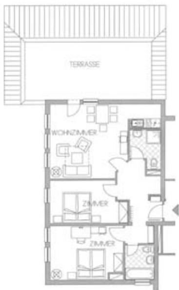
Zimmertyp H Belegung 6+0 Nr. 307