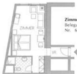
Zimmertyp B Belegung 2+0 Nr. 611