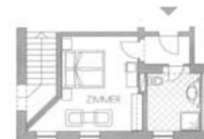
Zimmertyp B Belegung 2+0 Nr. 114