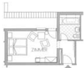
Zimmertyp B Belegung 2+0 Nr. 407