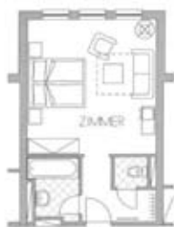
Zimmertyp C Belegung 2+1 Nr. 109 211 309