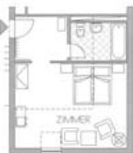
Zimmertyp A Belegung 2+0 Nr. 409