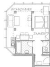
Zimmertyp C Belegung 2+1 Nr. 606