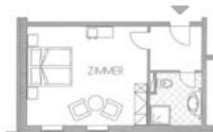
Zimmertyp B Belegung 2+0 Nr. 314