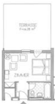
Zimmertyp B Belegung 2+0 Nr. 608