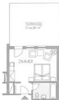
Zimmertyp B Belegung 2+0 Nr. 610