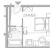
Zimmertyp A Belegung 2+0 Nr. 405