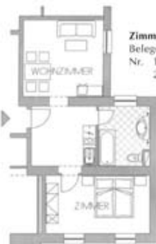
Zimmertyp G Belegung 4+0 Nr. 113 215